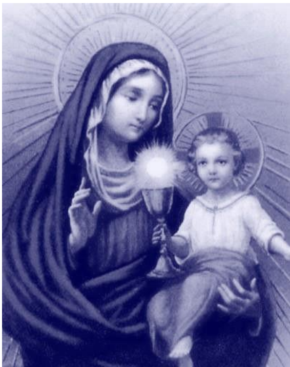
A matriz geradora dos filhos de Deus

Aprenderam que “a única precaução contra os ataques da morte é a inocência da vida” (Bossuet).